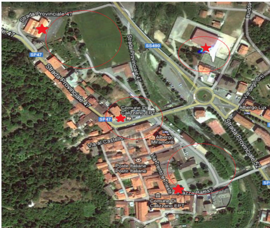
Ubicazione HotSpot e Aree di copertura

All'interno del capoluogo Calizzanese sono stati installati 4 HOTSPOT WIFI che consentono l'accesso ad Internet gratuitamente previa registrazione .